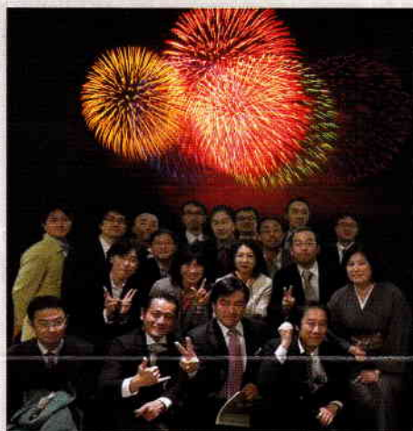
会場内のスナップはホームページに 掲載します。

また当日は撮影隊が会場を巡回しますので、仲間同士の撮影の折にはお気軽にお声かけください。